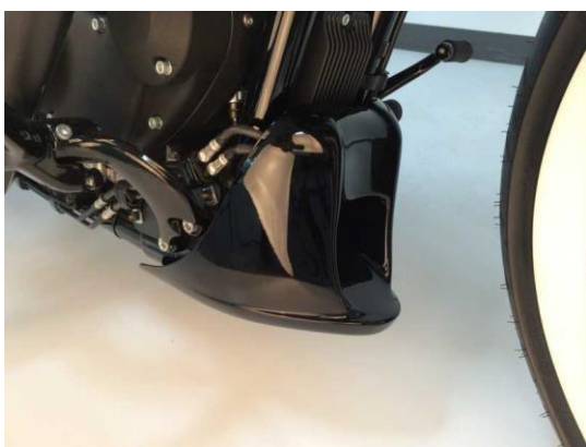
Abb. 1 – montierter Bugspoiler

Wir empfehlen, für alle Schrauben eine mittelfeste Schraubensicherung (z.B. LOCTITE 243, blau) zu verwenden.