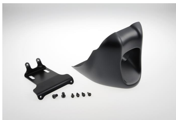
Abb. 2 – Bugspoiler „Bobber“