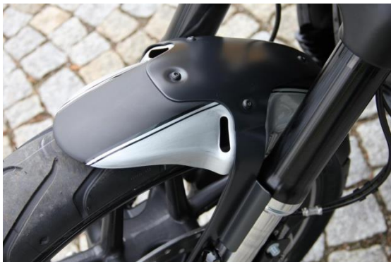
Abb. 1 - montierter Frontfender