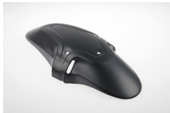
Abb. 2 - Frontfender "Special"