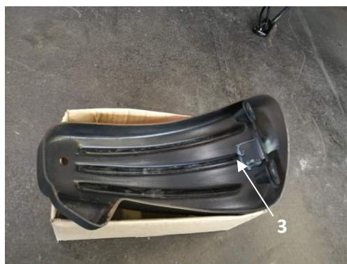
Abb.1, Seitendeckel links